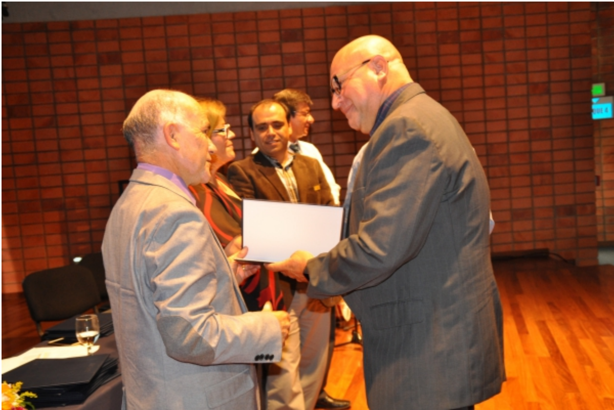
Momento de la entrega de los títulos que los acredita como profesionales en en Ingeniería Vial aplicada a la Red Vial Cantonal.