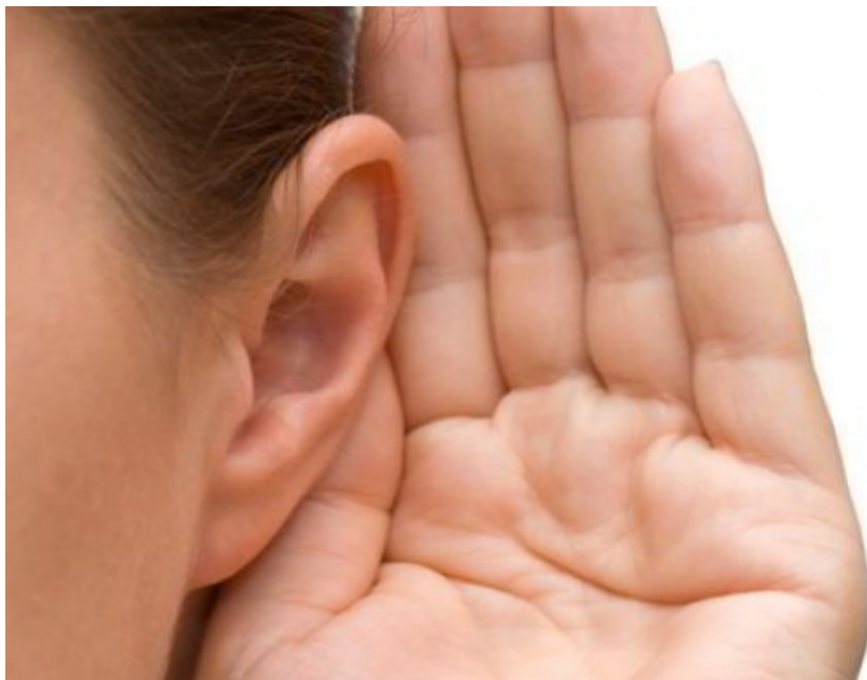
Fotografía ilustrativa