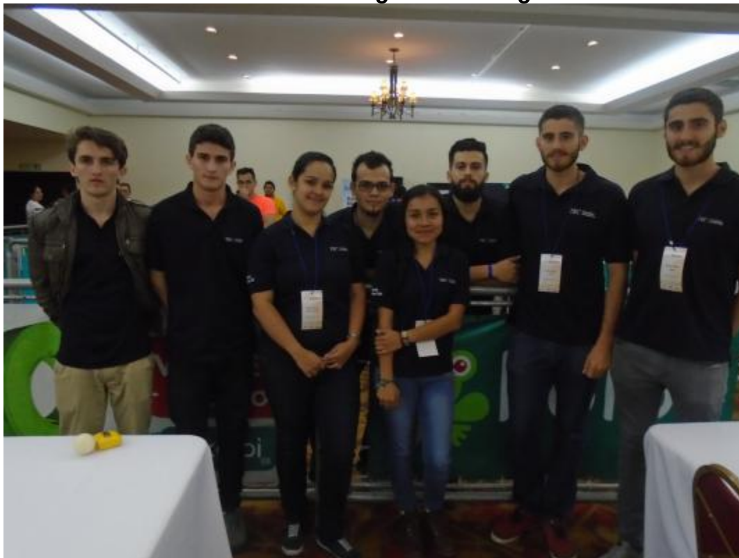
Estudiantes de diversas carreras del TEC participaron en la competencia realizada en el Hotel Wyndhan.