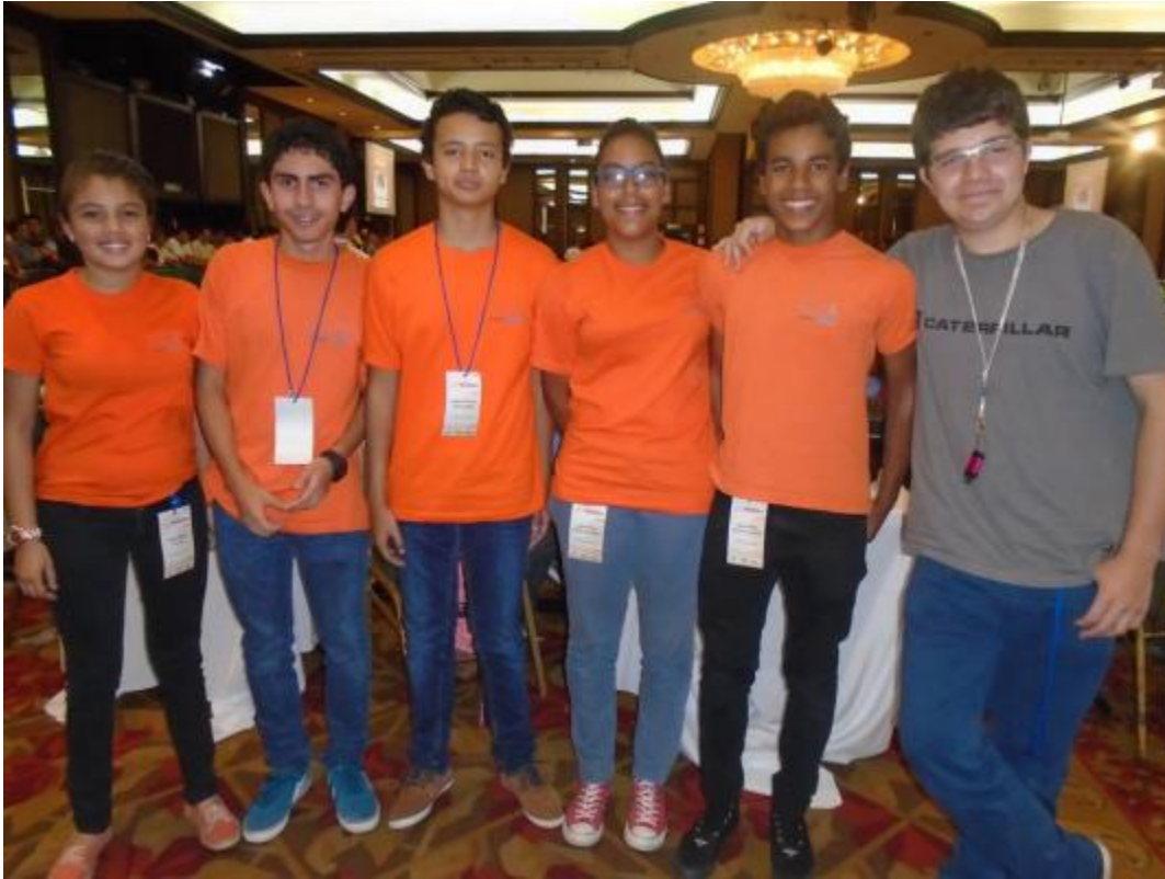
Miembros de la delegación B y C de ACB Mecatrónica.