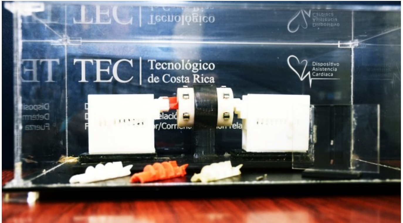
Dispositivo experimental de impulsor de sangre.

Dispositivo beneficiará a pacientes con insuficiencia cardíaca