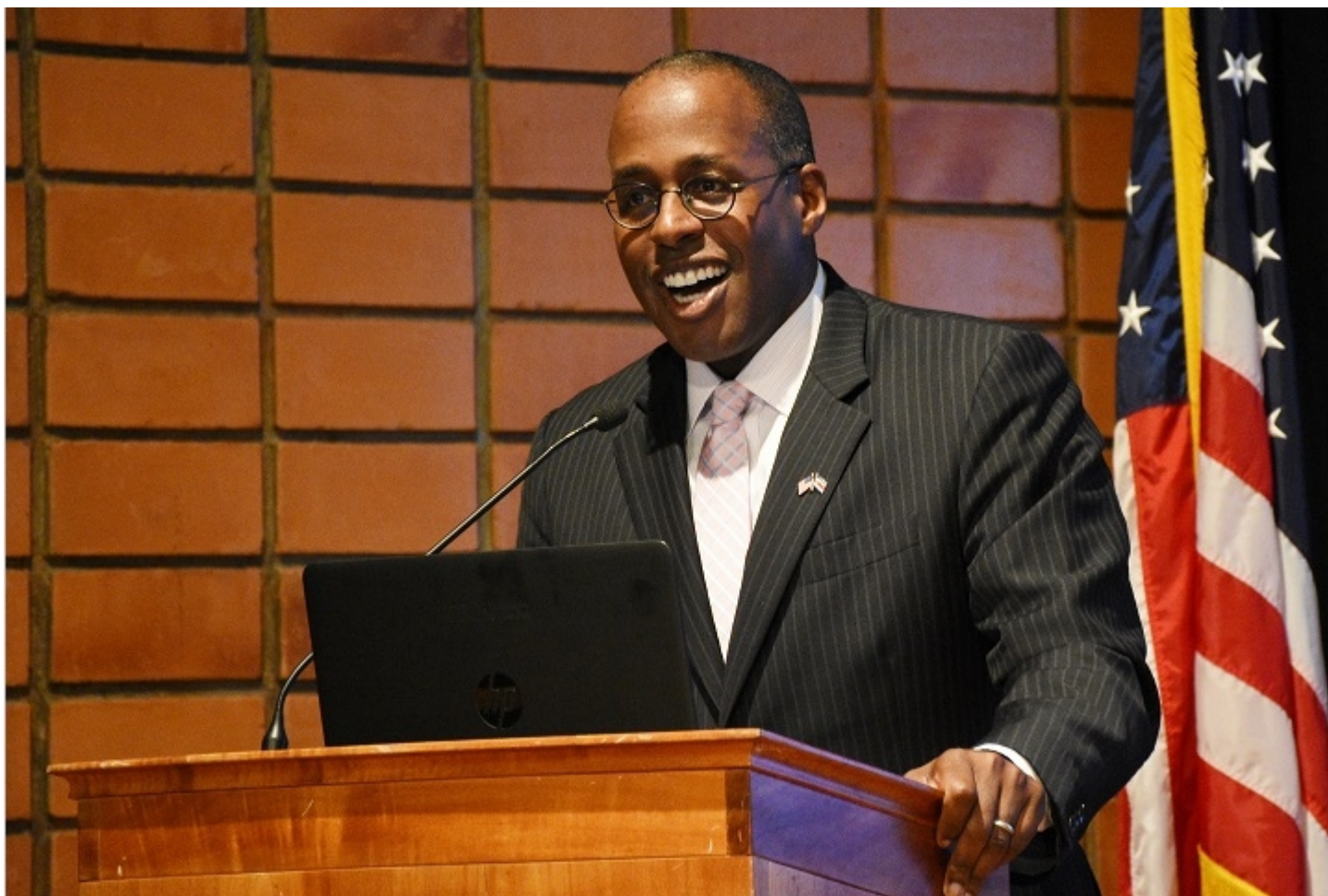
Fitzgerald Haney, Embajador de EEUU en Costa Rica manifestó en su discurso el

El evento representó el inicio formal del vigésimo noveno curso lectivo de los Colegios Científicos desde su fundación en 1989. Estos centros de estudio se encuentran distribuidos en nueve sedes alrededor del país y enfocan su modelo de enseñanza en matemáticas, biología, física y química. La sede de Cartago está ubicada dentro de las instalaciones del TEC.