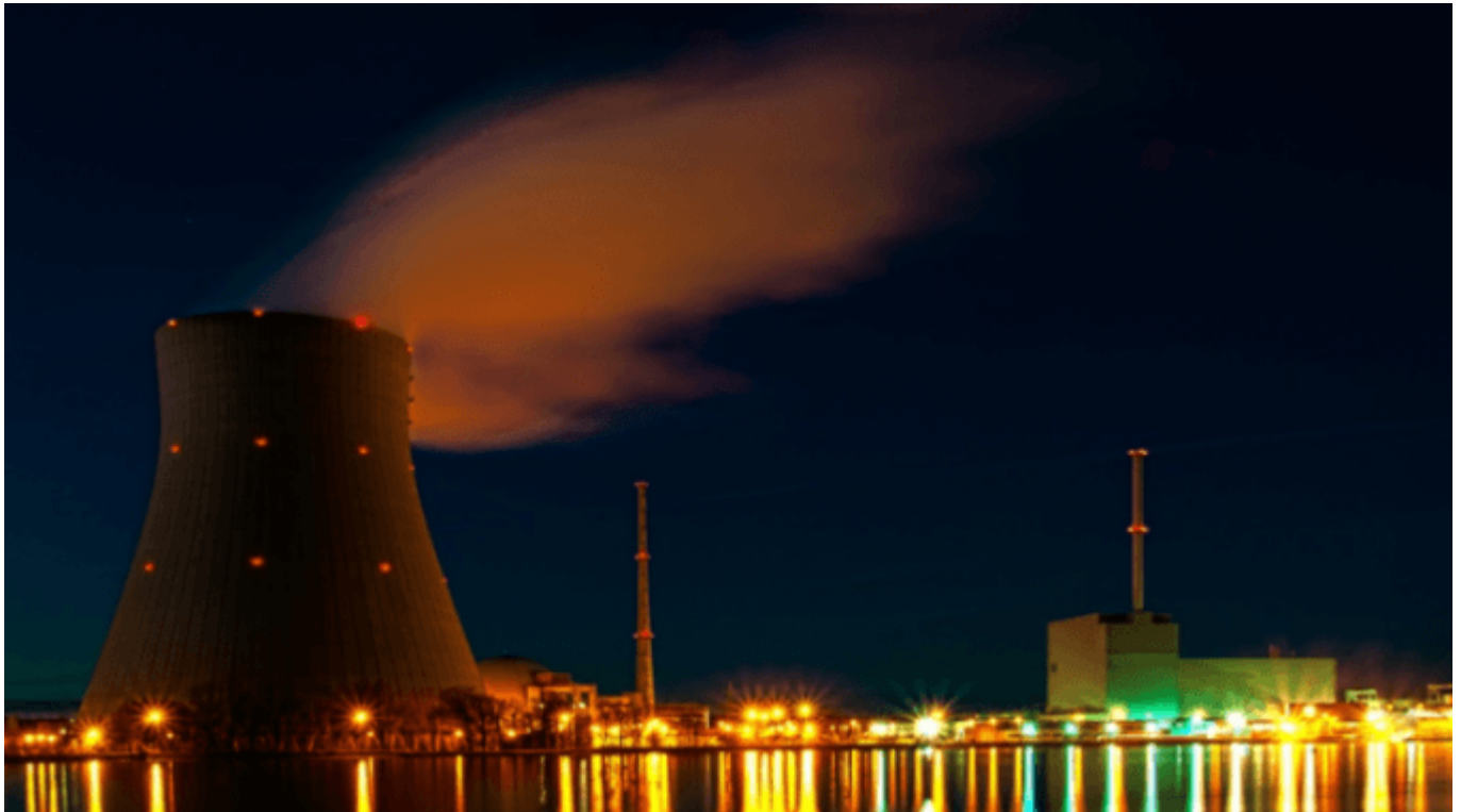
Planta nuclear "Isar" ubicada en Alemania.