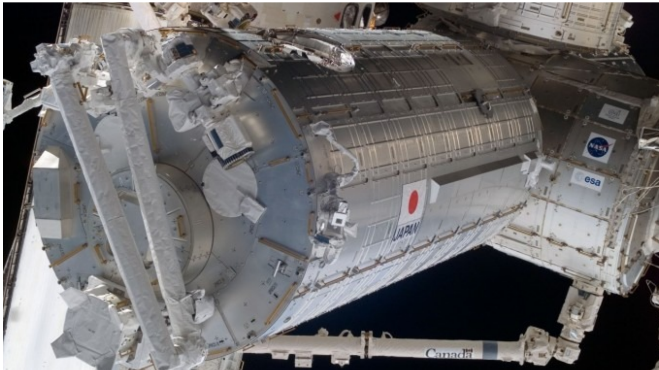
Fotografía del módulo japonés Kibo, del que se liberó en órbita el satélite costarricense.