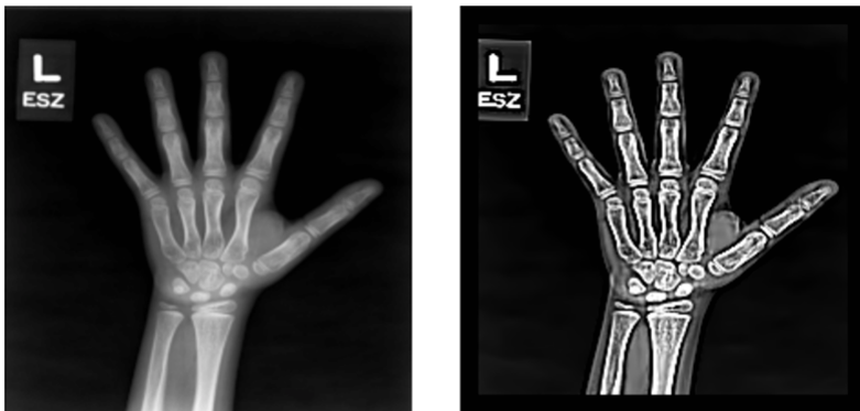
(a) Original image

Los especialistas del Grupo Parma utilizaron una técnica de inteligencia artificial conocida como Deep Learning para que el modelo “aprendiera”, por medio del análisis de una gran cantidad de imágenes, a identificar la edad de los sujetos a los que pertenecen las radiografías.