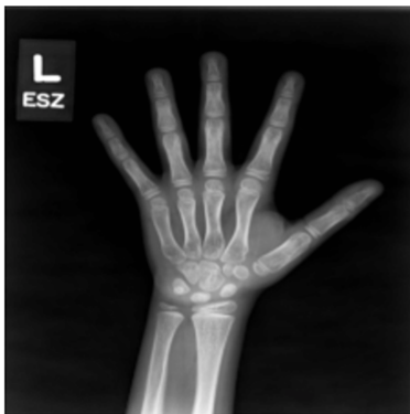
(a) Original image

Los especialistas del Grupo Parma utilizaron una técnica de inteligencia artificial conocida como Deep Learning para que el modelo “aprendiera”, por medio del análisis de una gran cantidad de imágenes, a identificar la edad de los sujetos a los que pertenecen las radiografías.