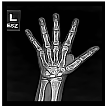
(b) DNLN-IFFT output

Así se ve la radiografía después de que se le aplican los filtros para reducir el ruido y mejorar los bordes.