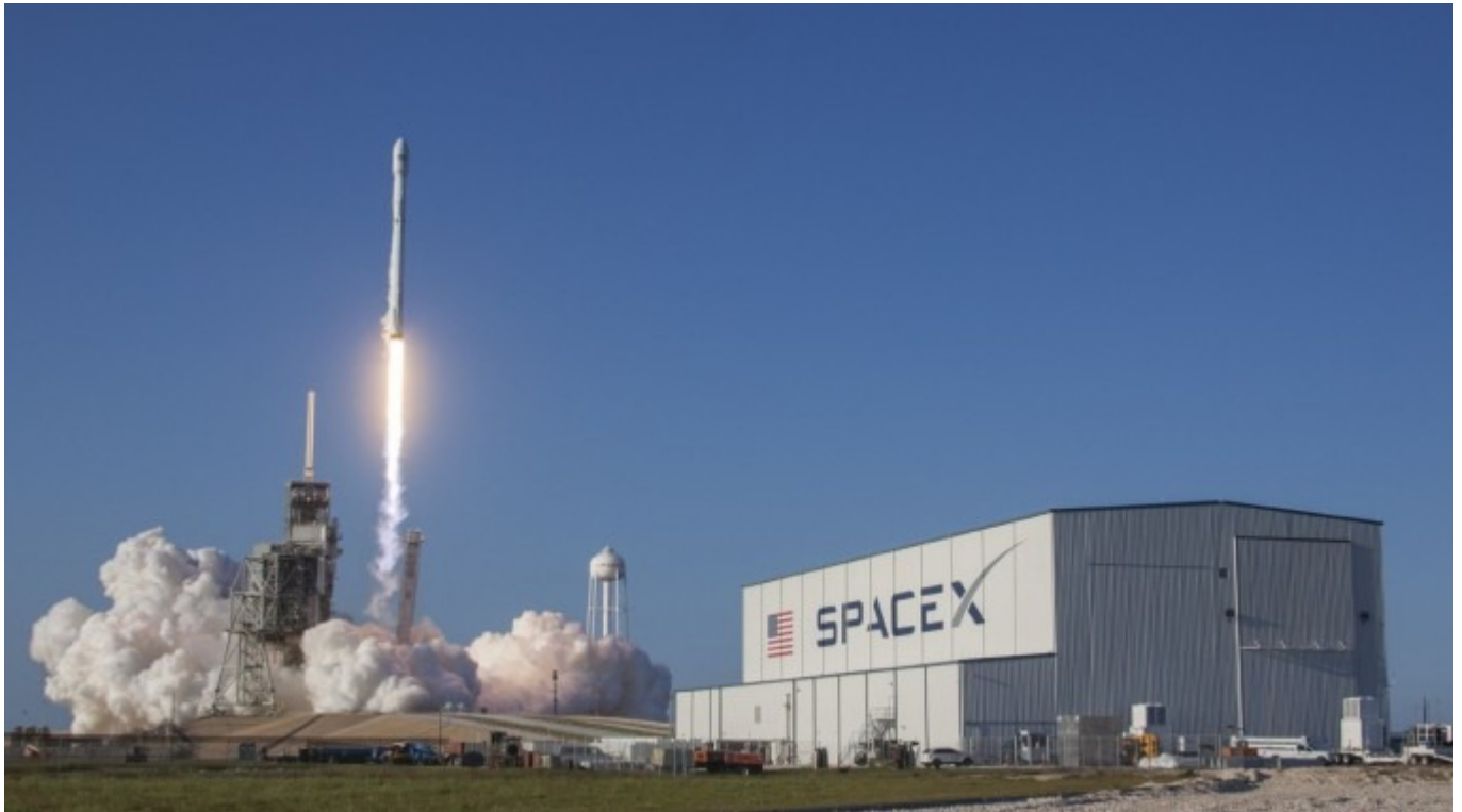
Despegue de uno de los cohetes de la compañía privada Space X