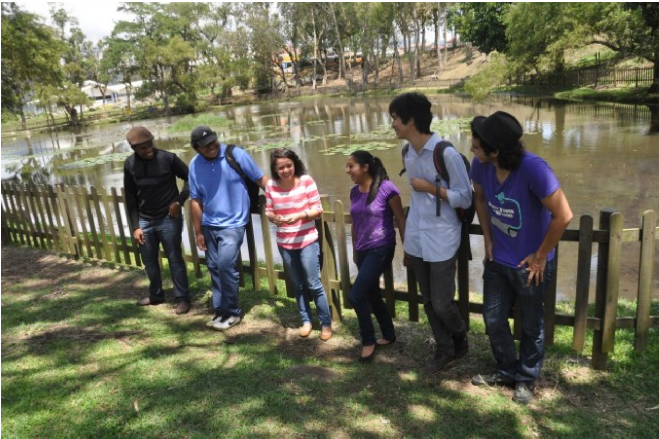
Imagen con fines ilustrativos de estudiantes del TEC.

Los estudiantes en IntegraTEC aportan desde su rol como líderes de equipo, coordinadores, líderes honorarios o mentores. Durante todo el proceso, ellos tienen la oportunidad de recibir formación en liderazgo y habilidades socioemocionales que favorecen su desarrollo integral, a la vez que ejercen una labor voluntaria de acompañamiento en el proceso de integración de las nuevas generaciones de la Institución.