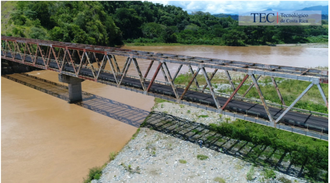
Fotografía con fines ilustrativos, cortesía eBridge.