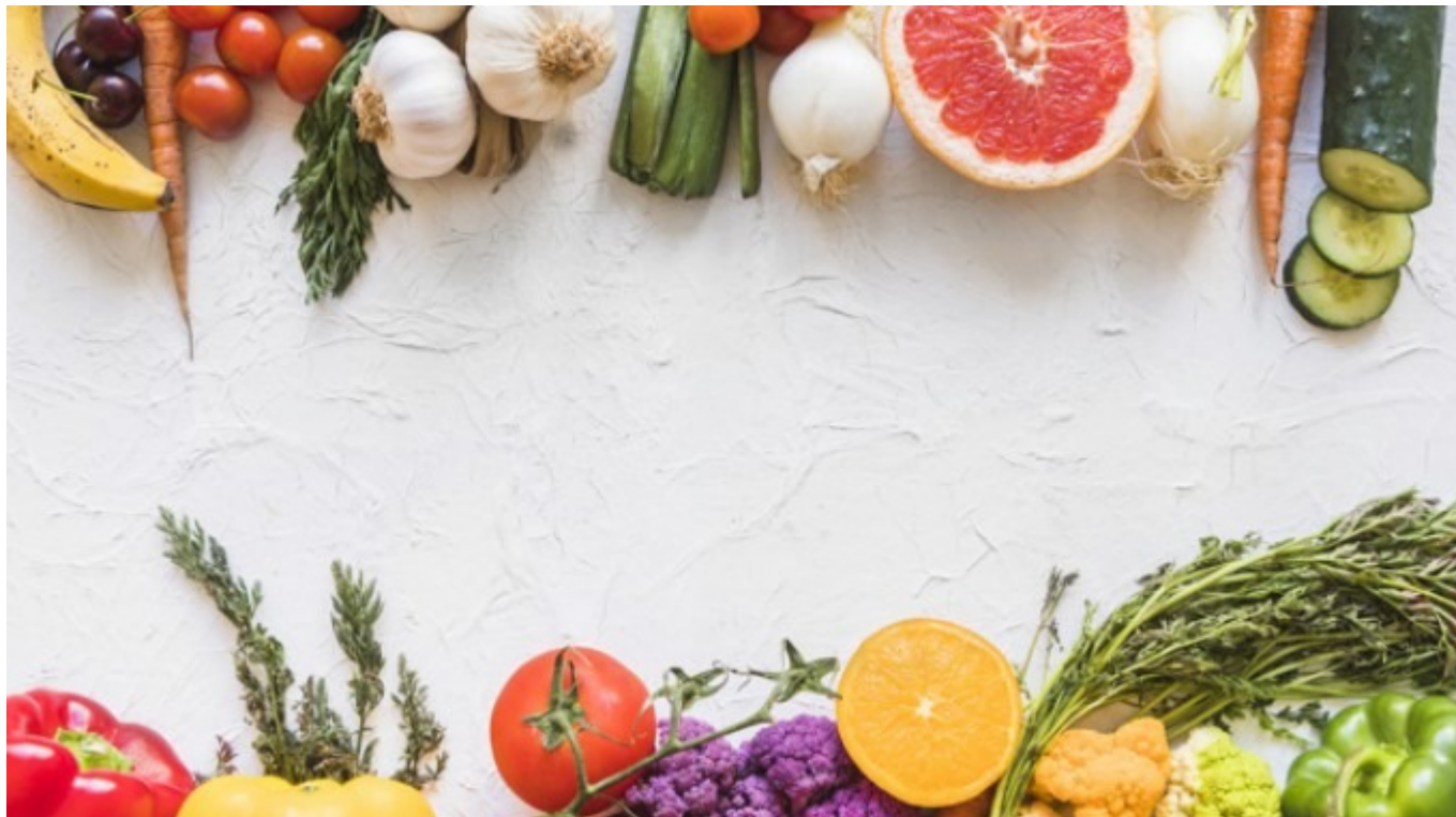
Imagen con fines ilustrativas.