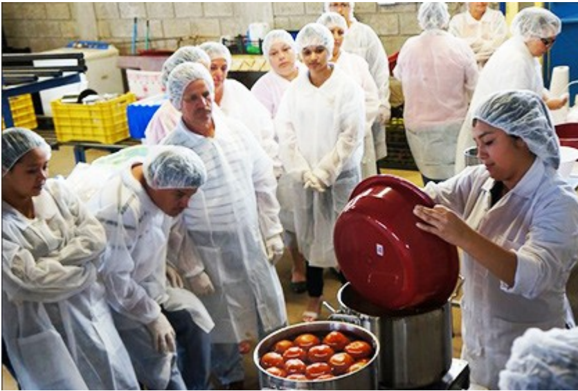
La Escuela de Agronegocios realizó una capacitación sobre la deshidratación del tomate. Una opción de valor agregado al producto.