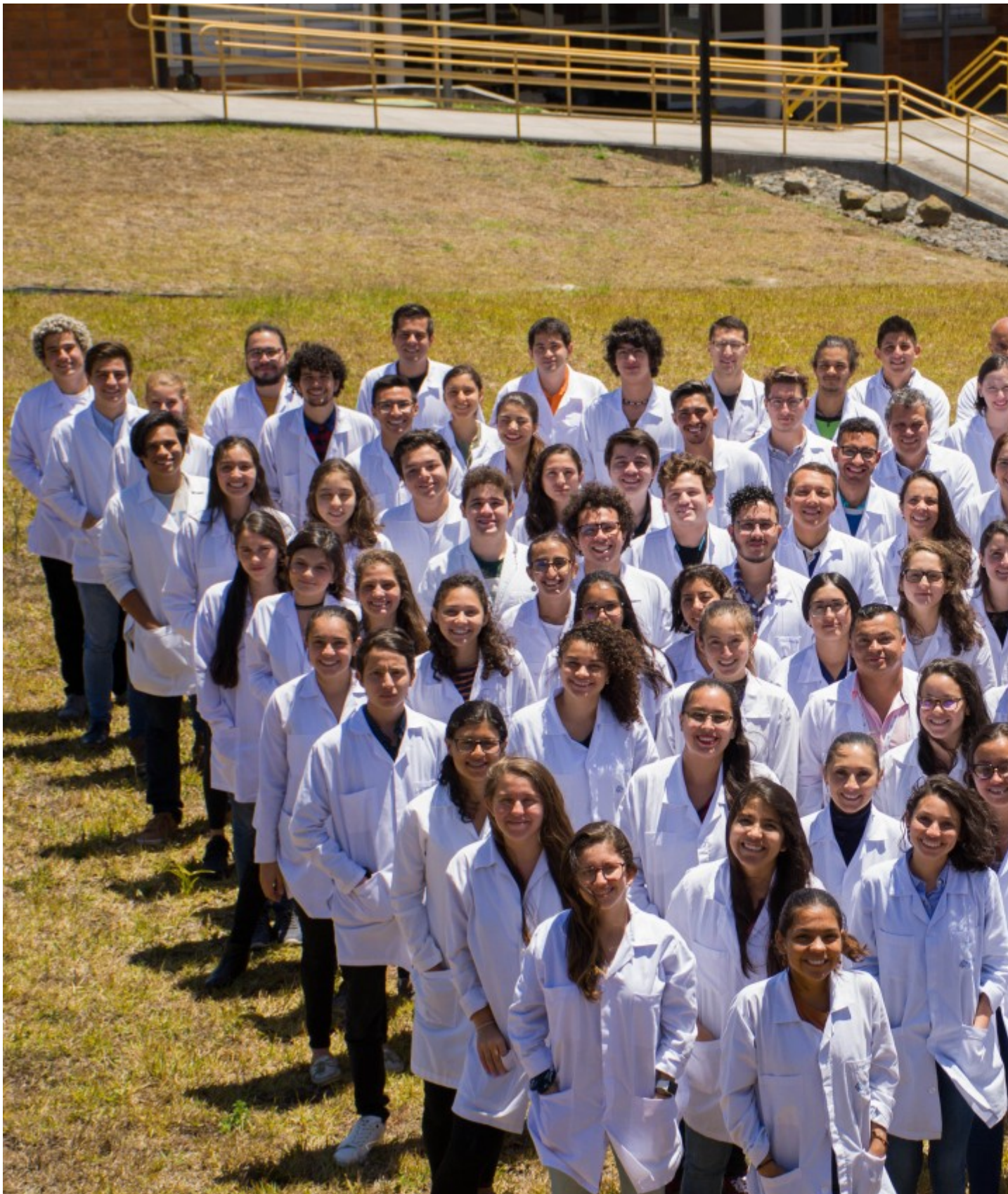
En la actualidad, en el CIB laboran 36 científicos y 87 estudiantes.