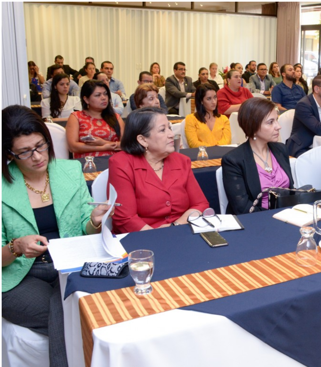
El evento oficial se realizó en el Hotel el Guarco. (Fotografía: Ruth Garita /