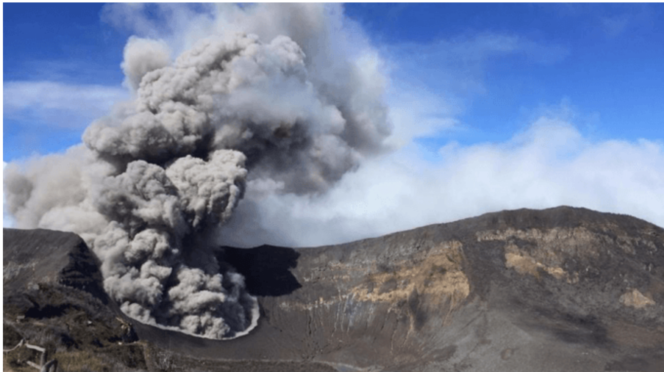
Fotografía del volcán Turrialba. Tomada el 28 de noviembre de 2018 por la guardaparque Reina Sánchez.