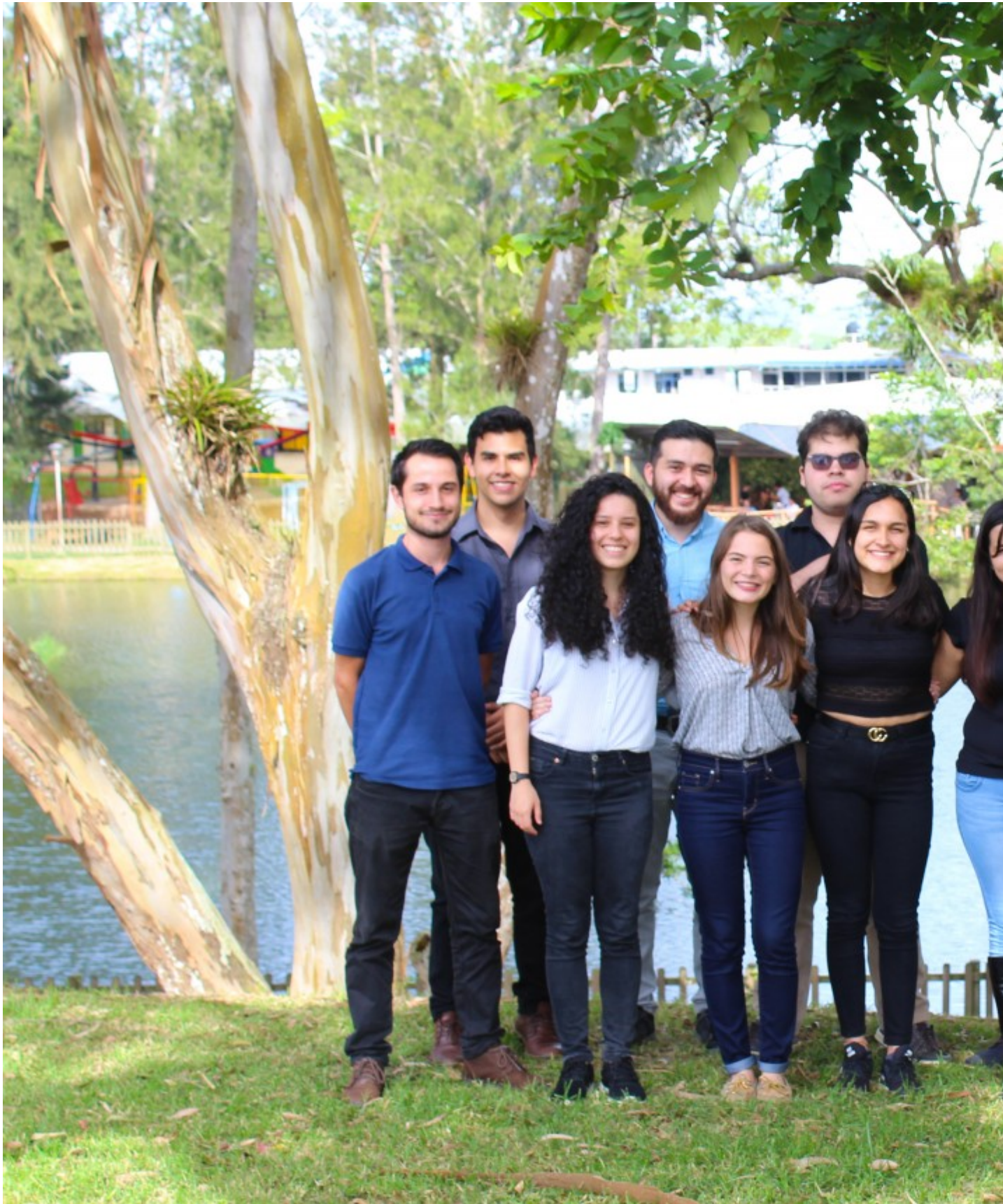
Los estudiantes del grupo TECSpace lograron clasificar con su proyecto MUSA, a la