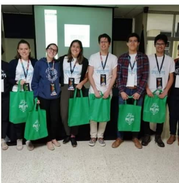
Ganadores del del NASA International Space Apps Challenge 2019.

El International Space Apps Challenge es una competencia mundial organizada por el Programa de Incubación de la Innovación de la Administración Nacional de la Aeronáutica y del Espacio (NASA, en inglés) [4].