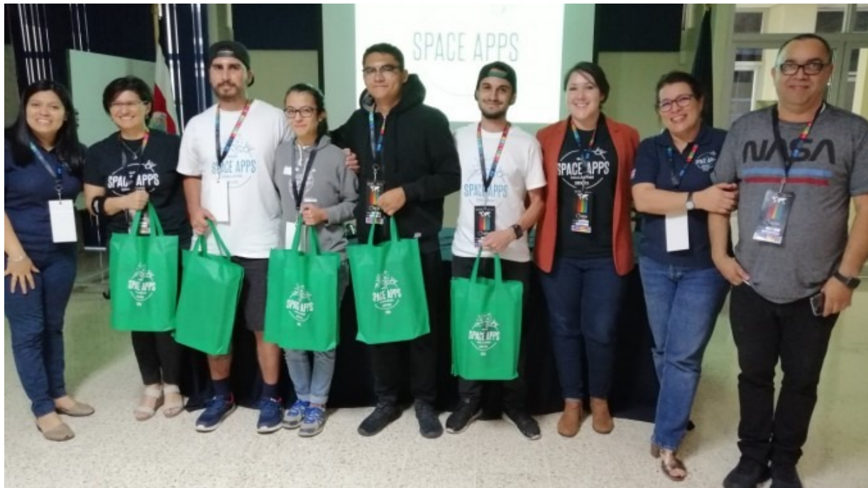
Ganadores del NASA International Space Apps Challenge 2019.