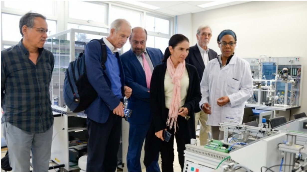
Visita de personeros del Banco Mundial en el Laboratorio de Mecatrónica del TEC.