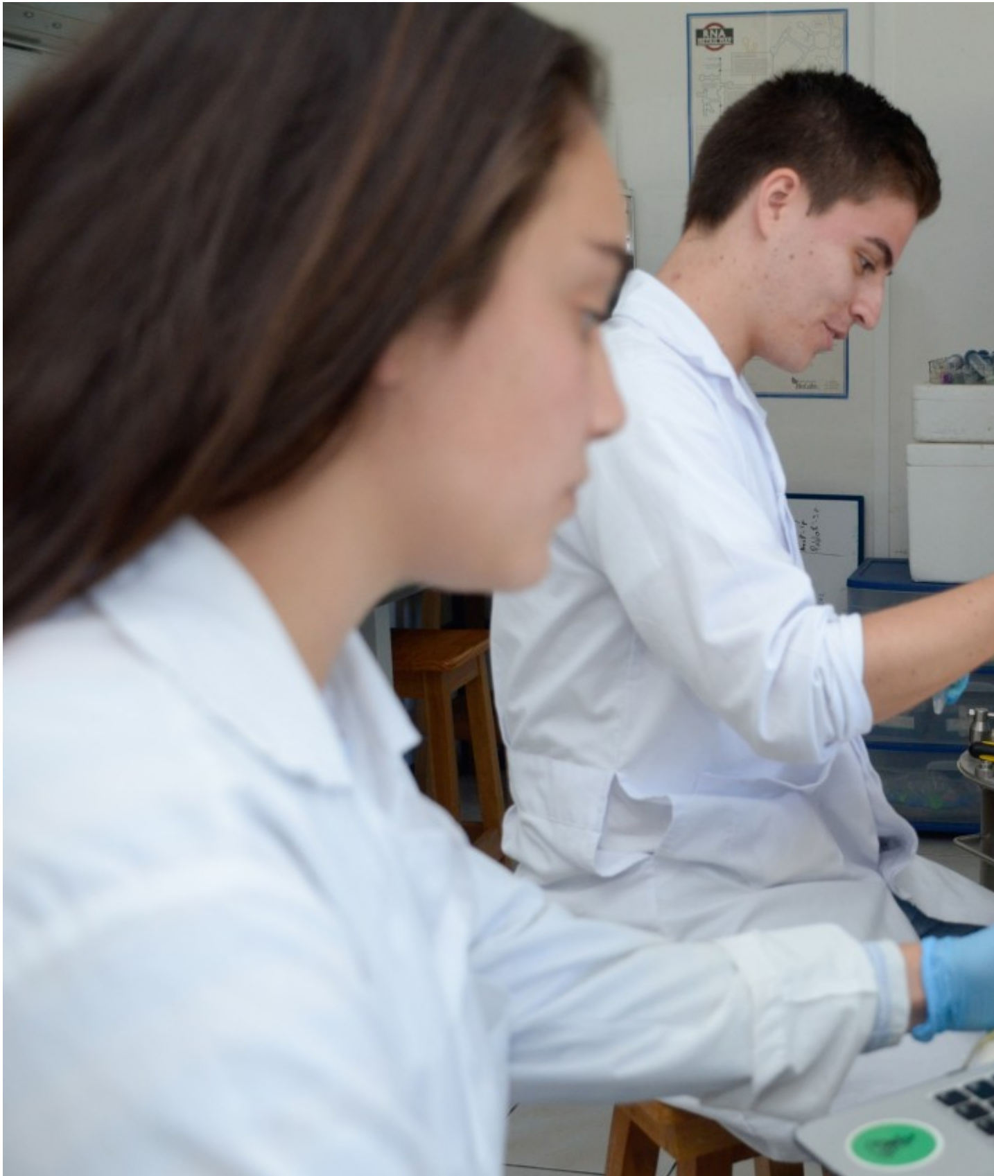
Estudiantes del TEC en el laboratorio de bioemprendimiento.