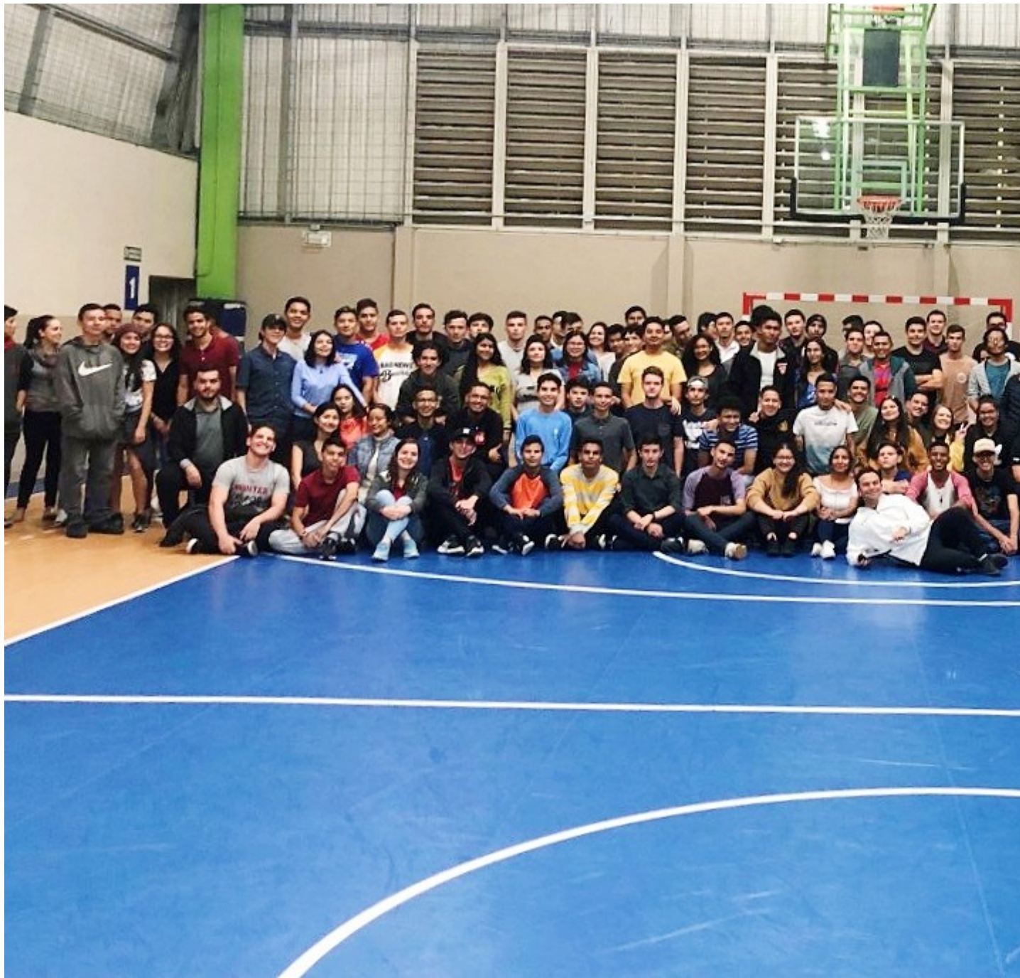
Generación PAR 2020.

Source URL (modified on 11/11/2020 - 11:40): https://www.tec.ac.cr/hoyeneltec/node/3760