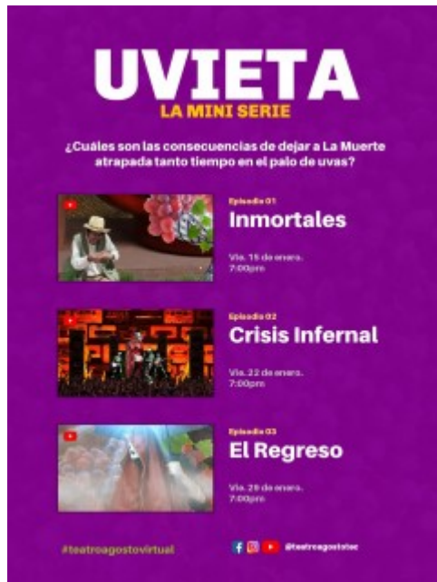
Uvieta: la miniserie.

“Utilizamos una gran variedad de recursos tecnológicos para darle vida al montaje, desde filtros de aplicaciones móviles para cambiar el aspecto facial de algunos personajes hasta programas de diseño y modelado en 3D para realizar la casa de tía Panchita y el armario. También usamos programas de edición fotográfica para crear los escenarios junto a la colección de objetos, además de programas de edición de vídeo y animación para crear el producto final”, especificó Morales.