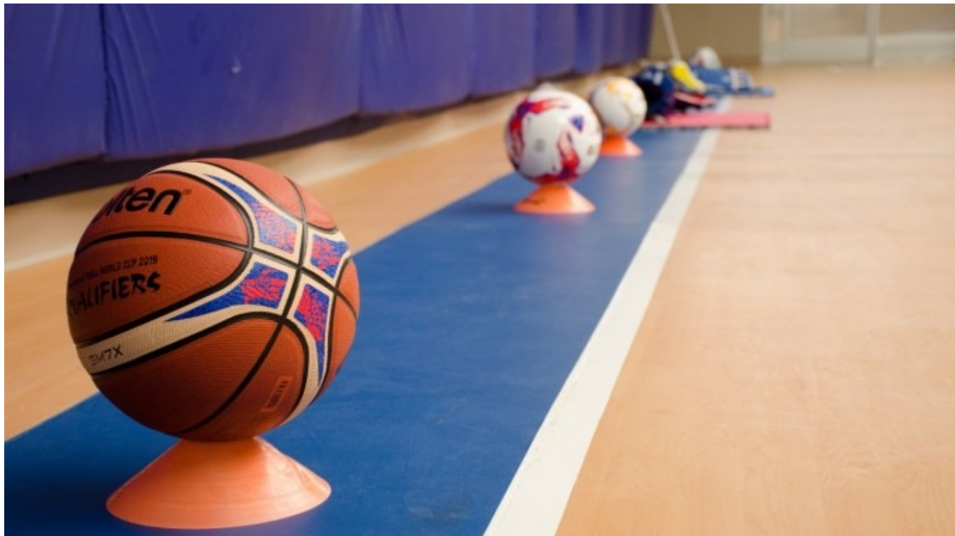
Imagen con fines ilustrativos.