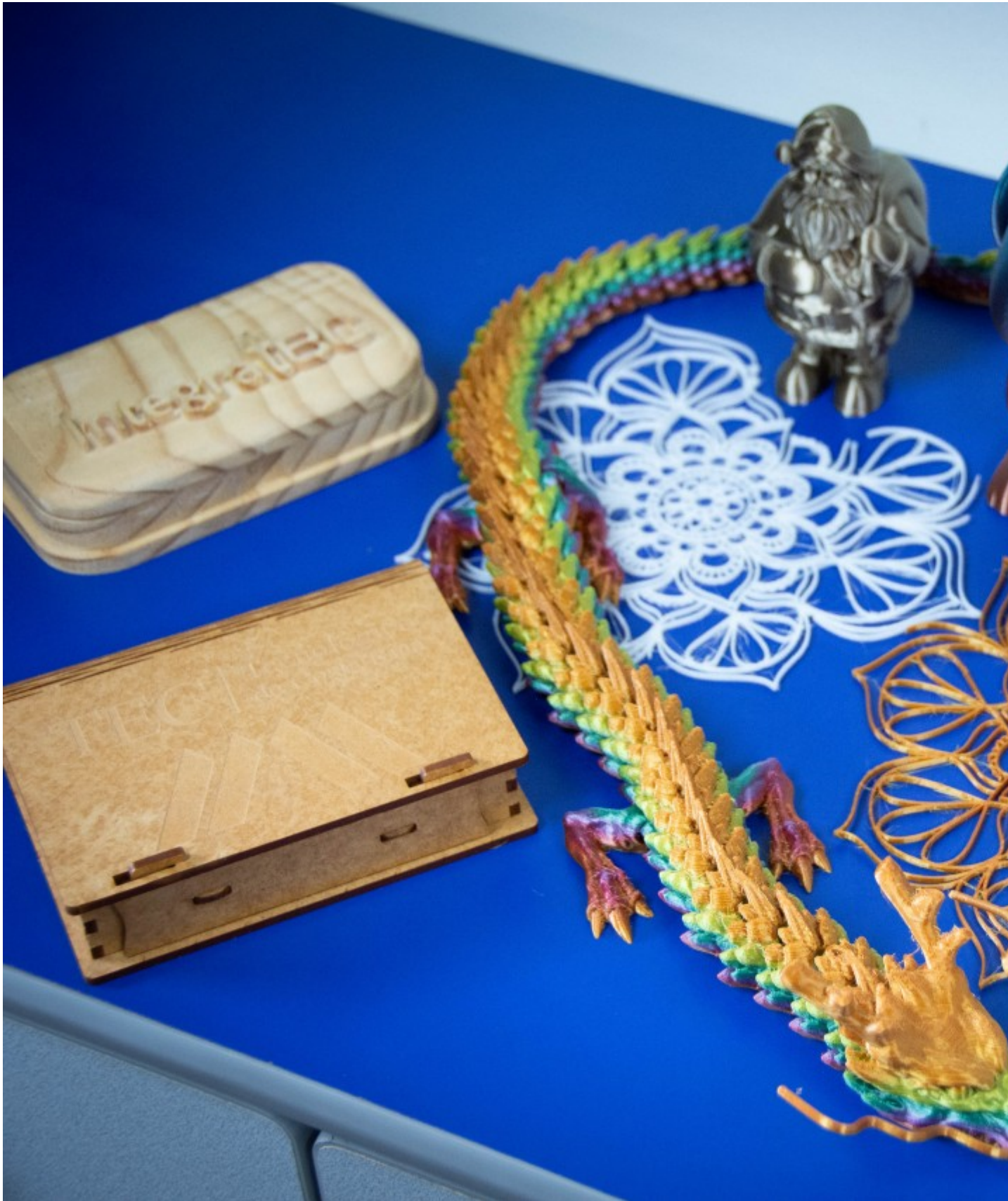
En los laboratorios del LAIMI se ofrecen diversos servicios para estudiantes, entre