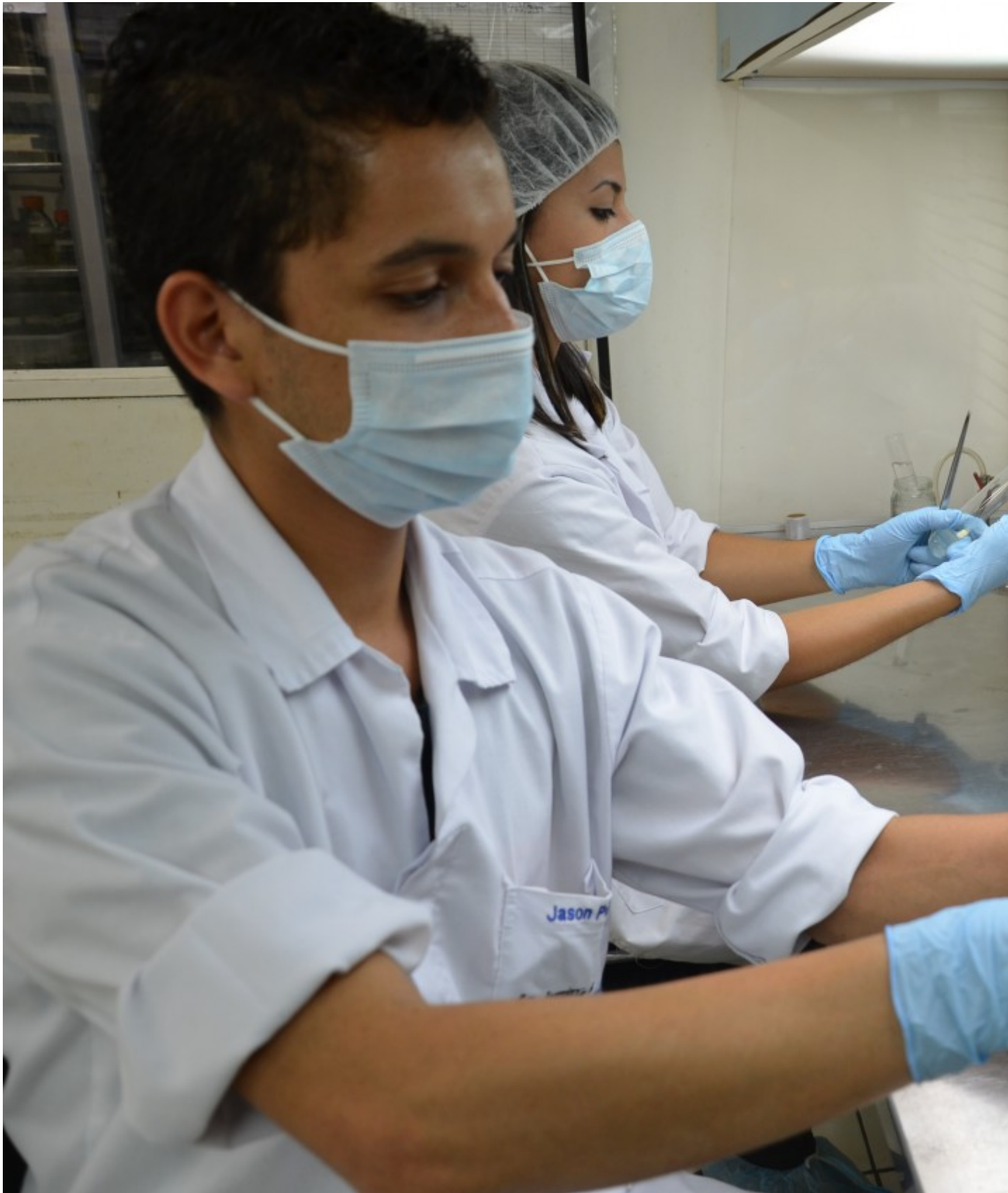
Investigaciones realizadas por estudiantes en el CIB.