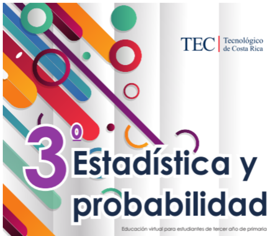
Portada del libro: Probabilidad y Estadística.