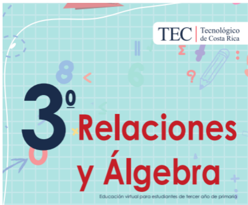
Portada del libro: Relaciones y Álgebra.