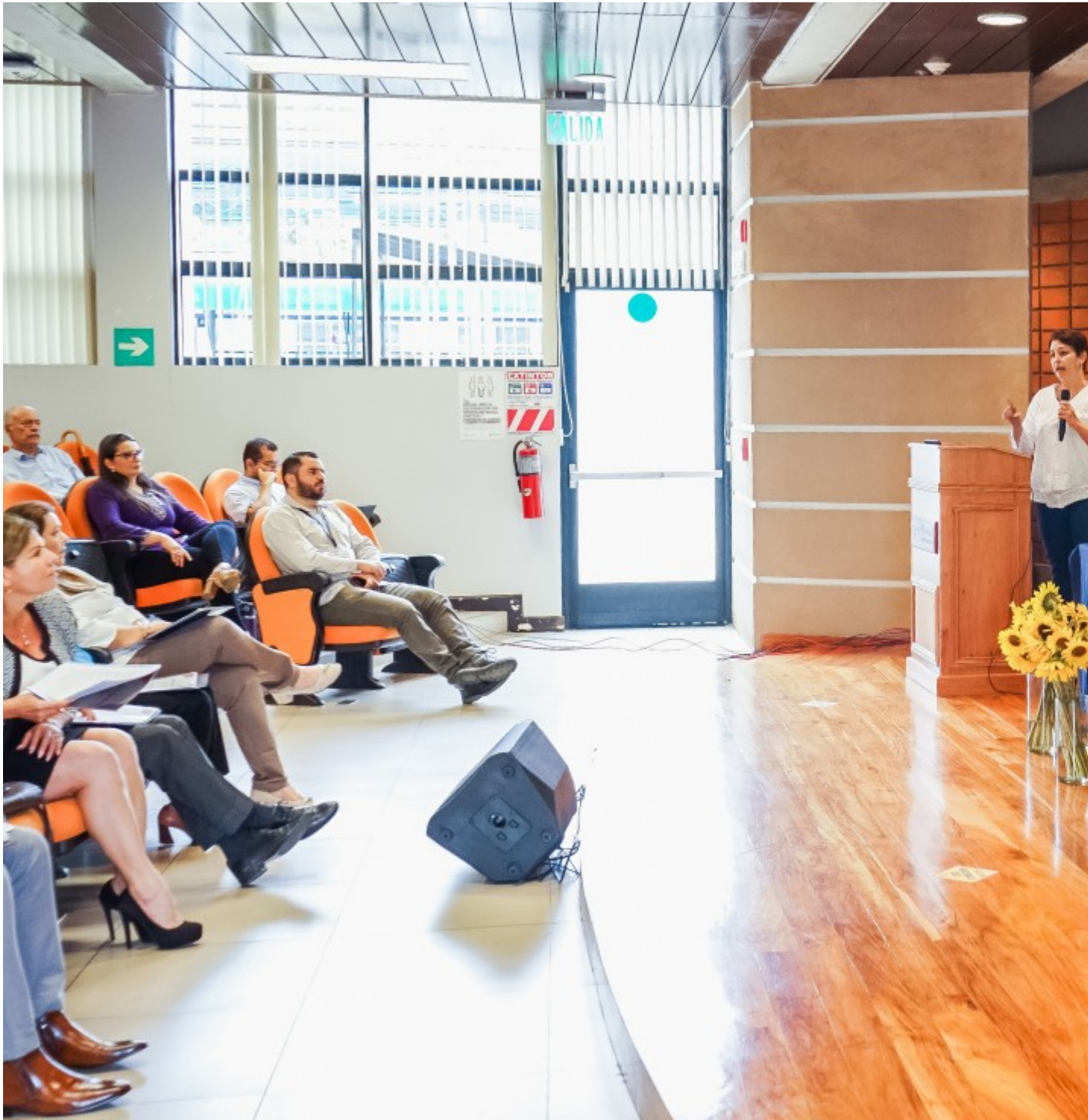
La actividad se realizó en el auditorio del Edificio D3 01 en el Campus Central de Cartago.

Source URL (modified on 05/30/2023 - 11:02): https://www.tec.ac.cr/hoyeneltec/node/4494