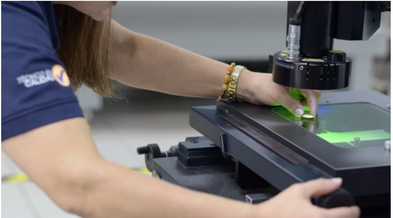
Fotografía de Archivo.

Escuela de Ingeniería en Producción Industrial