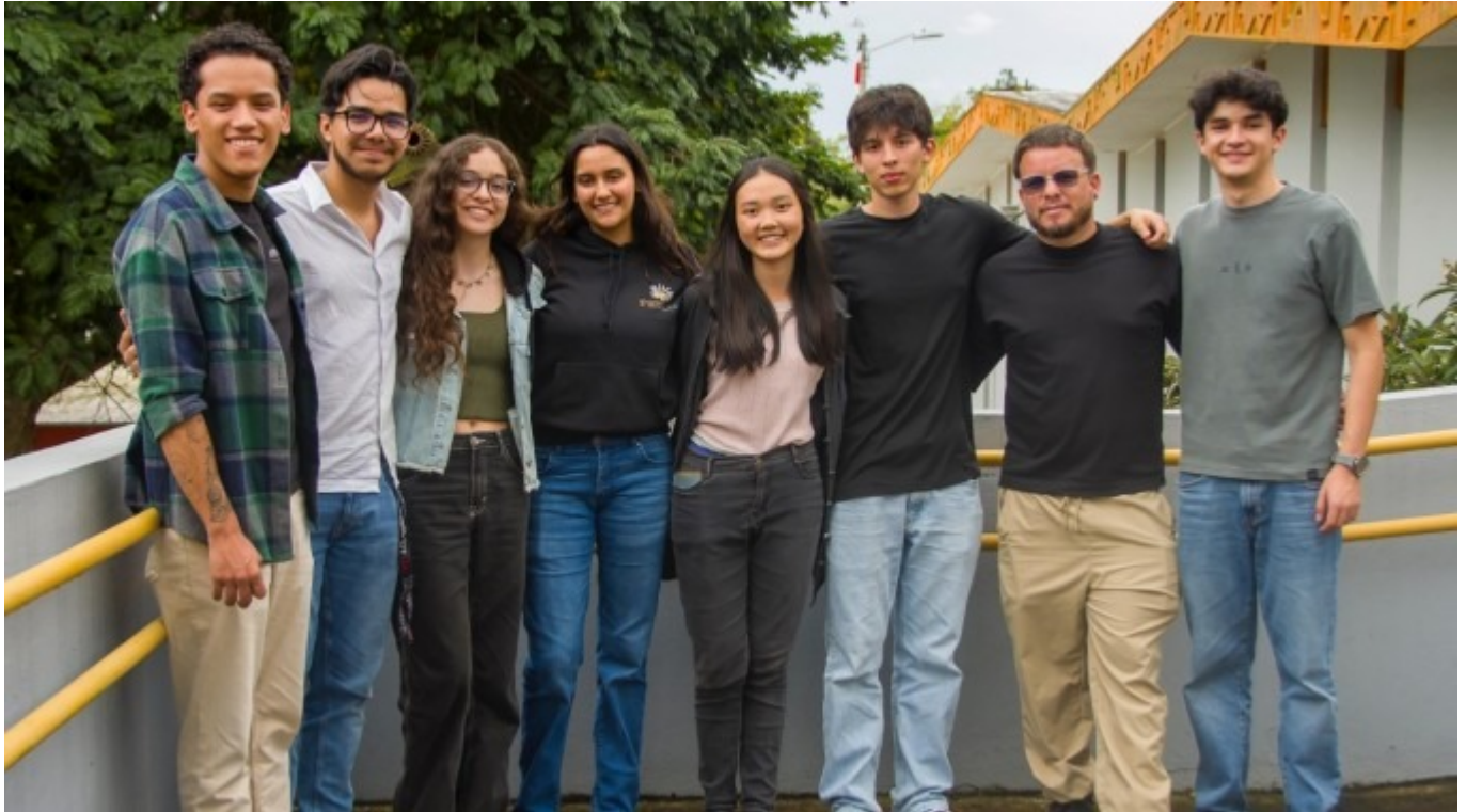
Parte de la delegación de TecSpace que participó en Congreso II Congreso Espacial Centroamericano (CEC).