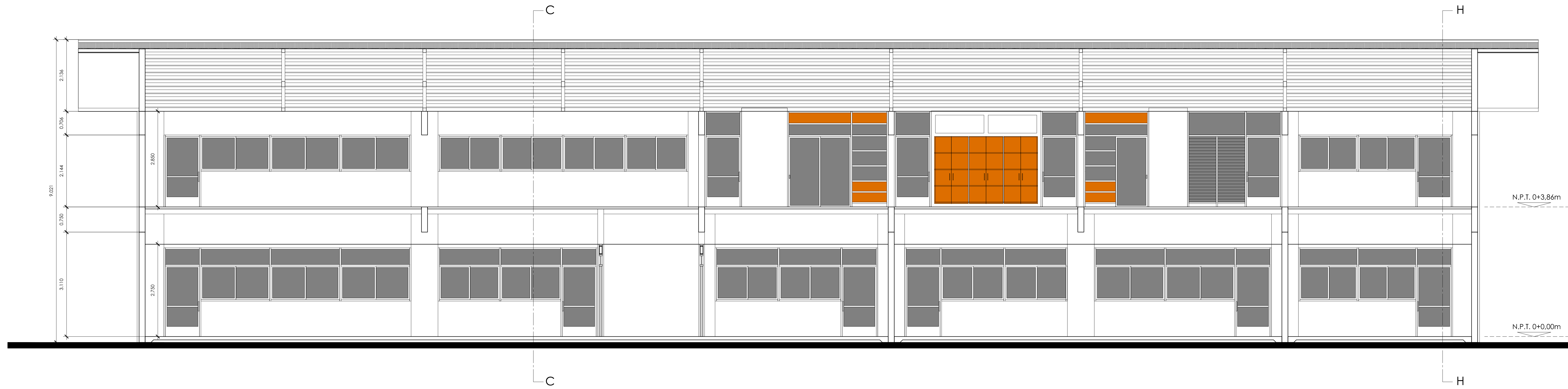
CORTE EE escala 1: 50