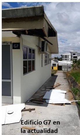
Edificio G7 en la actualidad

Dado que hay deterioro y rezago en comparación de otras entidades públicas y privadas