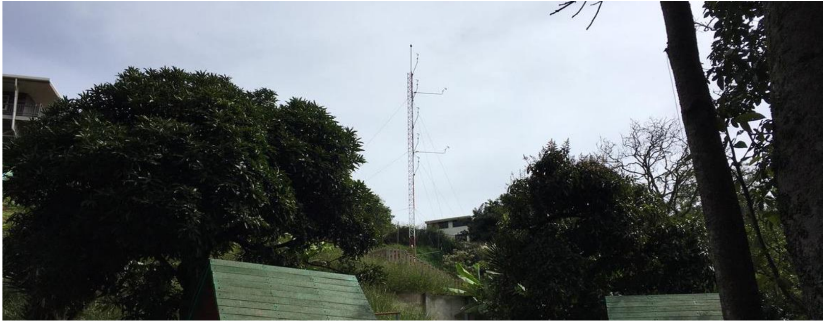
Ilustración 1. Torre de pararrayos instrumentada con anemómetros y veletas.