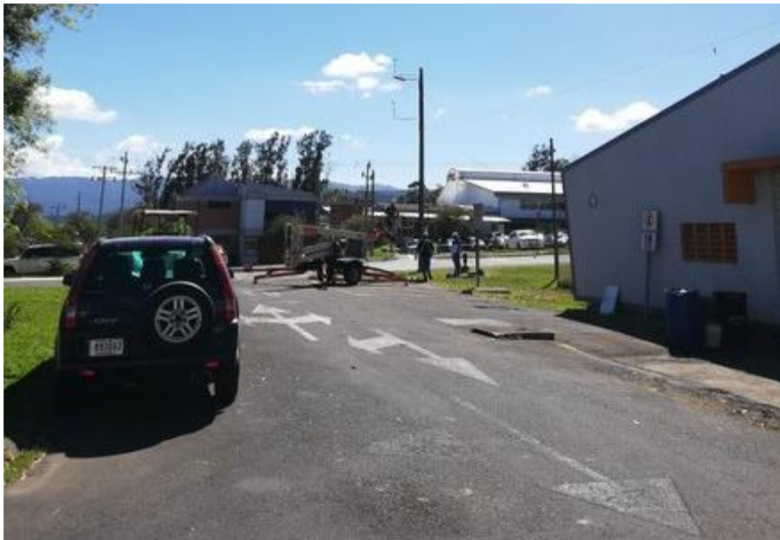
Figura 1. Poste con anemómetros en los alrededores de la EIE 1 .

El Laboratorio de Investigación en Energía Eólica (LIENE) tiene instalado un punto de medición en la Escuela de Ingeniería Electromecánica, en el Instituto Tecnológico de Costa Rica (TEC), con coordenadas 9^{\circ} 51' 17.696'' Norte y 83^{\circ} 54' 40.392'' Oeste. En este punto se encuentran un poste con únicamente dos anemómetros a 8 y 10 metros de altura que miden velocidad del viento. La instalación de este punto de medición fue en diciembre del 2018 con el objetivo de guardar datos de velocidad del viento y así realizar diferentes estudios, como la obtención de intensidades de turbulencia.