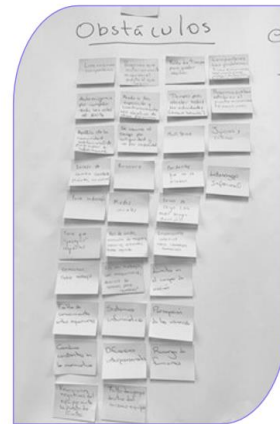
Actividades realizadas durante los grupos focales

El proceso de sistematización se realizó a partir de los hallazgos recolectados de los grupos focales y entrevistas individuales realizadas con funcionarias del ITCR. Reconociendo sus experiencias como fuerza legítima de saber y promueve la construcción conjunta de propuestas transformadoras.