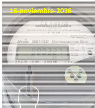
Figura 3. Consumo eléctrico trifásico