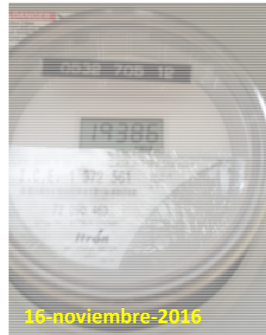
Figura 2. Consumo eléctrico monofásico