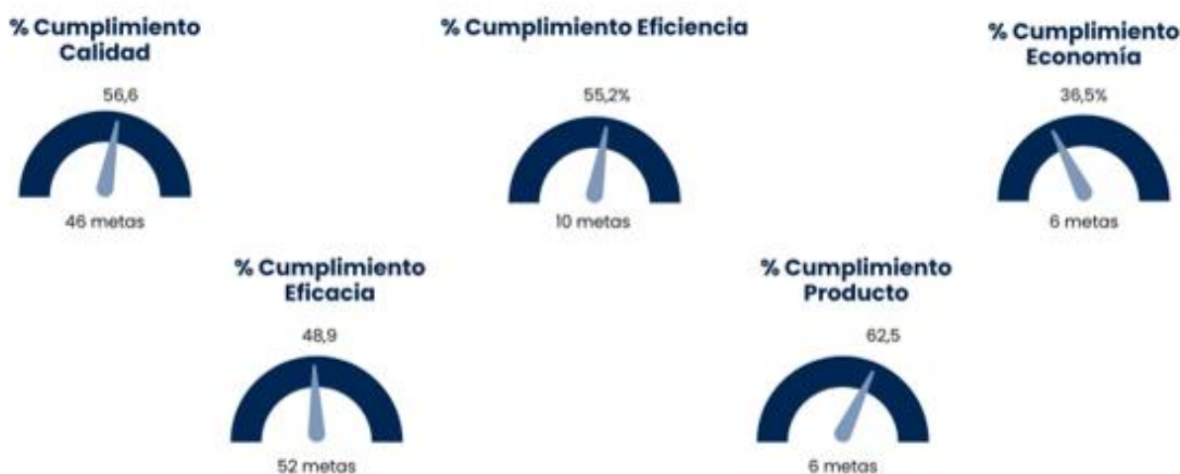
Figura 1. Nivel de cumplimiento de la meta, según tipo de indicador

Fuente: Informe de Evaluación Plan Anual Operativo 2023 al 30 de junio de 2023, pág. 156